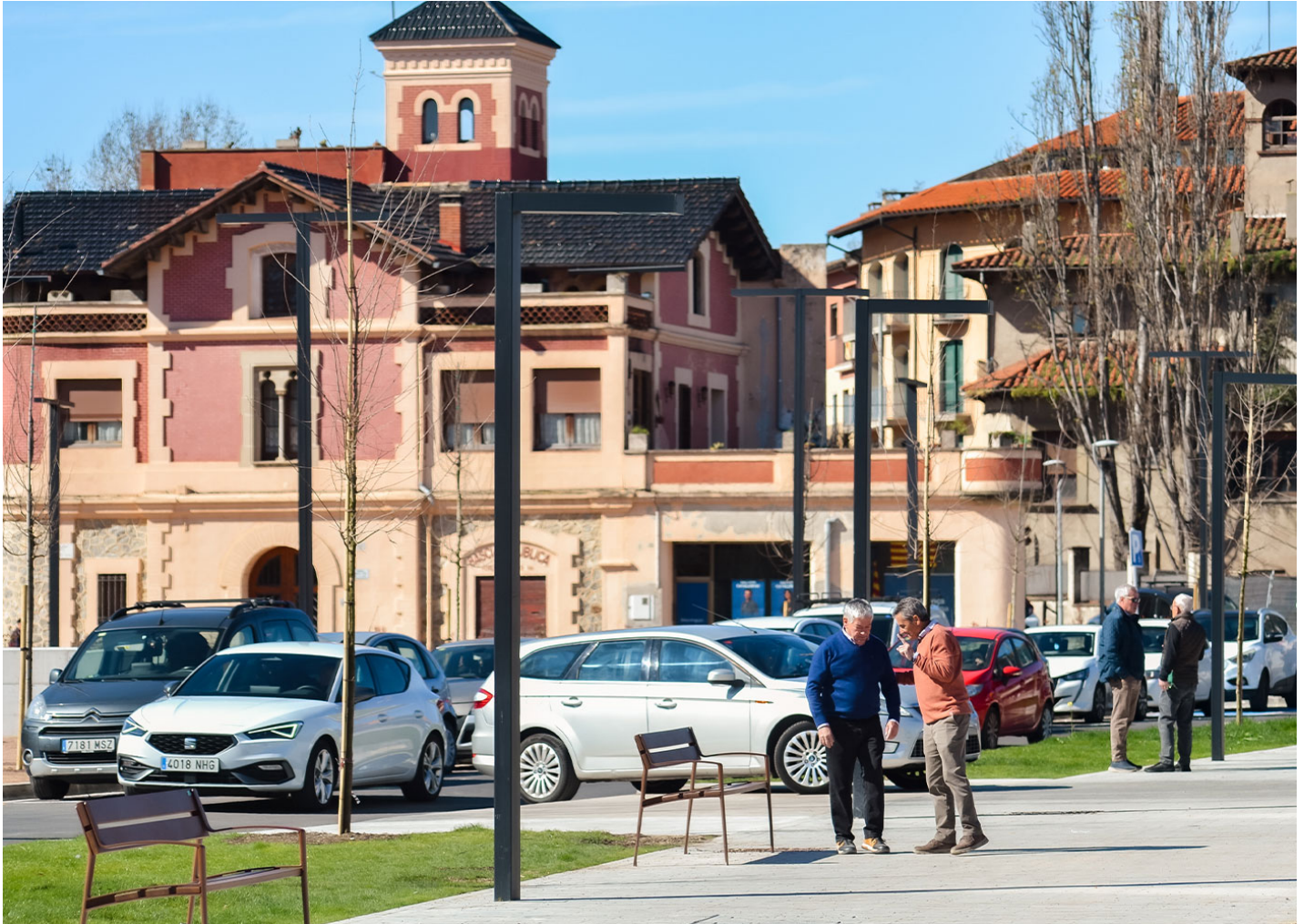
Mielek T PA691S

Passeig fluvial amb necessitats de renovació urbana i millora de l'ús per a vianants al Passeig del Ter, Manlleu (Barcelona)